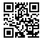
イムインターナショナル QRコード